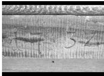
Die Jahreszahl weist auf das Jahr der Kirchweihe hin.

dienstbare Wesen, die Gott für seine Menschenkinder einsetzt. Ich wünsche Ihnen viele gute Erfahrungen mit Engeln und grüße Sie recht freundlich als Ihr Pfr. Sekes